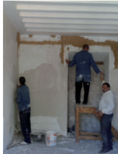
ترميم جدران المرسم Restauration des murs de l'atelier