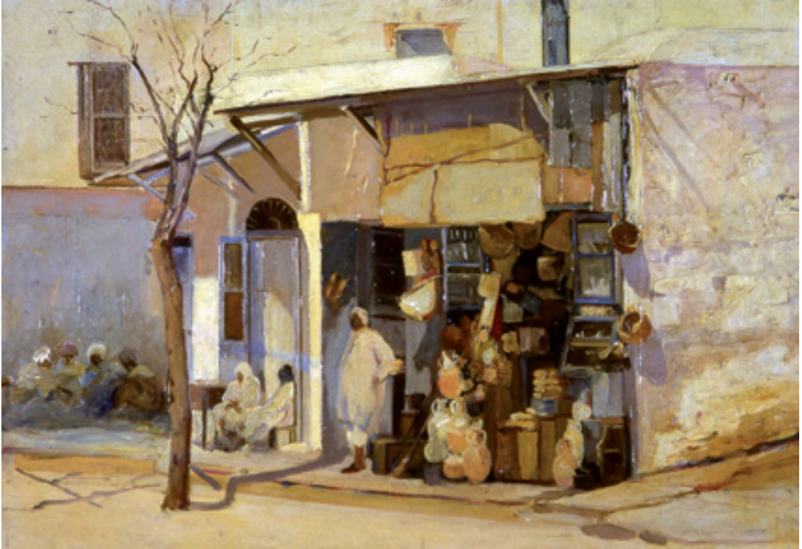
رودولف ديرلنجر مشهد بأحد أزقة سيدي بو سعيد . زيت على قماش 50 صم 73x صم Rodolphe d'Erlanger Scène de rue à Sidi Bou Saïd - huile sur toile - 50x73 cm

تتنمي معظم اللوحات المعروضة بالمرسم (وكذلك بالرواق الأزرق) إلى الفترة التونسية وهي تمثل جزءا من المجموعة التي اقتنتها الدولة التونسية في سياق الصفقة المتعلقة باقتناء قصر النجمة الزهراء (1989).