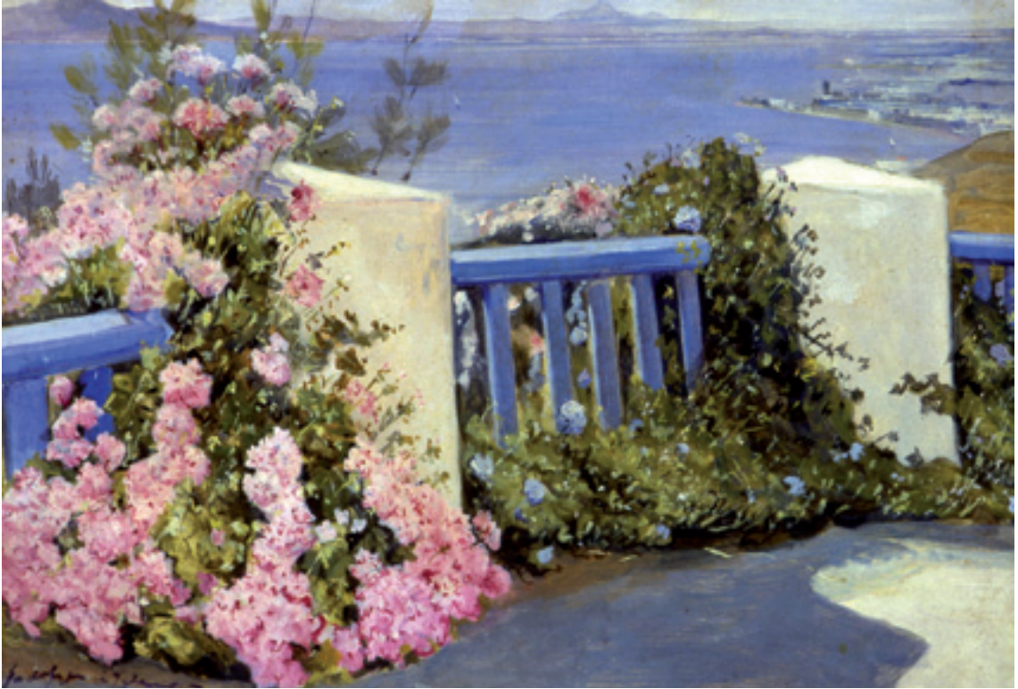
رودولف ديرلننجي الخليج - إبرة الراعي الزهرية. زيت على قماش 36 صم 53x صم Rodolphe d'Erlanger La baie - Les géraniums roses - huile sur toile - 36x53 cm