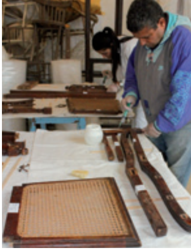
ترميم قطع أثاث Restauration de meubles