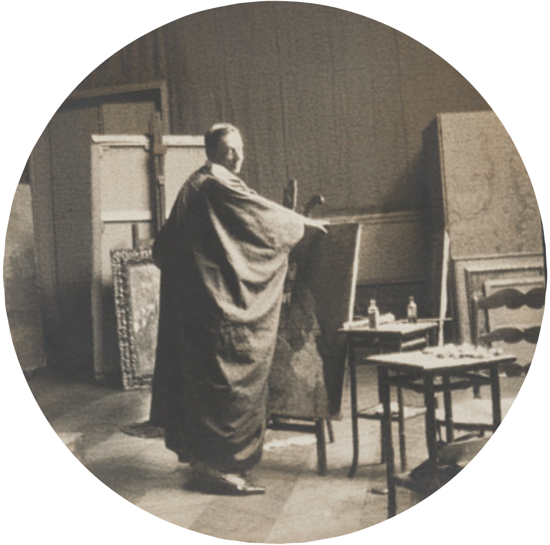
صورة للبارون ر. ديرلنجي يبرسمه – العشرية الأولى من القرن العشرين Photo ancienne du b. d'Erlanger dans son atelier - 1 ère décennie du XX es .