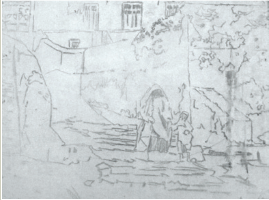
رودولف ديرلنجي تخطيط قلم غرافيت على قماش 60 صم 45x صم Rodolphe d'Erlanger Esquisse crayon graphite sur toile - 60x45 cm

يتقدّم مركز الموسيقى العربيّة و المتوسطيّة بخالص الشكر إلى كلّ من ساهم في إنجاح هذا المشروع و على وجه الخصوص فريق مؤسسة كمال الازعر و فريق المعهد الوطني للتراث و كل الخبراء في مجال التراث الذين ساهموا في التفكير الذي سبق إنجاز المشروع و من ضمنهم السادة فآخر الخراط و دوني لوساج و البشير صويد و أماني بن حسين.