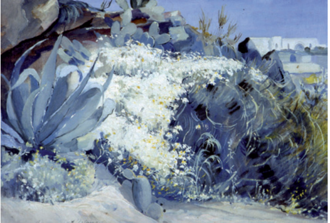
رودولف ديرلننجي الصبار . زيت على قماش 55 صم 38x صم - 1929 Rodolphe d'Erlanger Aloès - huile sur toile - 55x38 cm - 1929