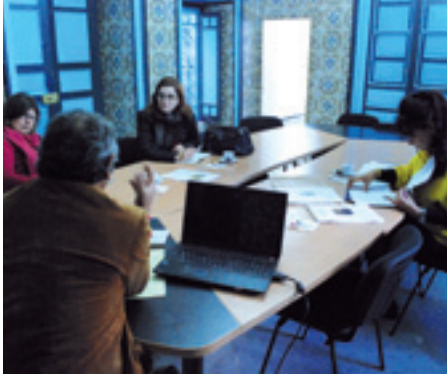
جلسة عمل حول المشروع Séance de travail autour du projet