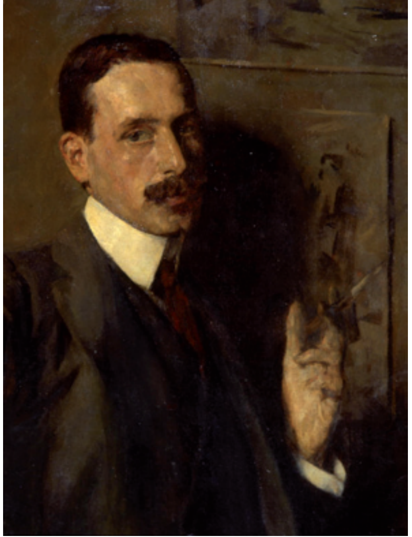
رودولف ديرلنجهي جزء من صورة ذاتية زيت على قماش 157 صم 120x صم Rodolphe d'Erlanger Détail d'un autoportrait - huile sur toile - 157x120 cm