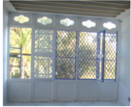
النافذة البلورية للمرسم Baie vitrée de l'atelier