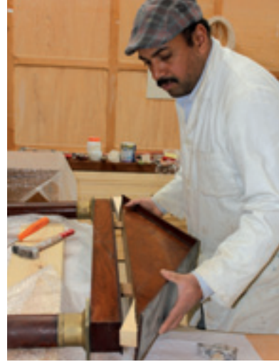
ترميم مرآة من مجموعة الأثاث الخاصة بالبارون Restauration d'un miroir de la collection du baron