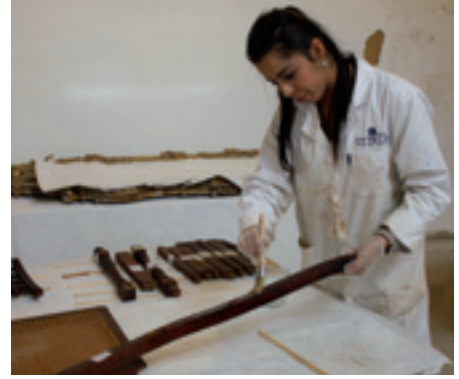
ترميم وعلاج الأثاث Traitement des meubles

أسهم الفريق المكلف من المعهد الوطني للتراث مساهمة قيمة في انجاز المشروع وخاصة في مجال ترميم العناصر الخشبية (السقوف والأبواب وقطع الأثاث وإطارات اللوحات الفنية)، علاوة عن الاشراف على عملية الانجاز ومتابعتها فنيا. وتندرج هذه المساهمة في صميم مهام المعهد المتمثلة في المحافظة على المعالم التاريخية وترميمها وصيانة المواقع الأثرية والمجموعات العمرانية التاريخية والتقليدية. وقد أتاحت عملية الترميم الفرصة لأكثر من 10 طلبة من خريجي معهد مهن التراث لتلقي تكوين تطبيقي سيسهم حتما في تعزيز مهاراتهم العملية.