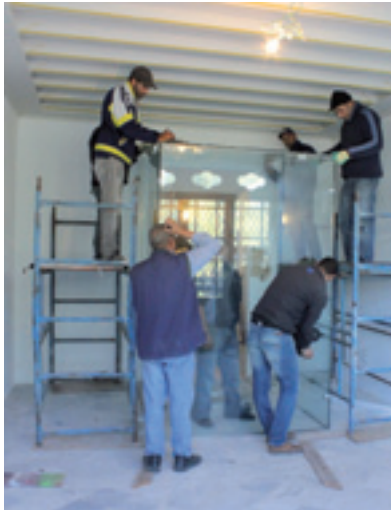
تركيب الصندوق الزجاجي Pose du sas en verre