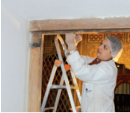
ترميم وعلاج خشب باب المرسم Restauration et traitement de la porte de l'atelier

L'apport des équipes de l'Institut National du Patrimoine (INP), organisme public dont l'une des missions principales est de « préserver, sauvegarder et restaurer les sites archéologiques, les monuments historiques et les ensembles urbains traditionnels », a été très précieux, notamment en matière de restauration des éléments en bois (plafonds, portes, meubles et encadrements des tableaux), ainsi qu'au niveau de la supervision des travaux. L'équipe de restaurateurs de l'INP a fait profiter de son savoir une dizaine de jeunes diplômés de l'Institut des Métiers du Patrimoine, qui ont été associés aux travaux de restauration en tant que stagiaires.